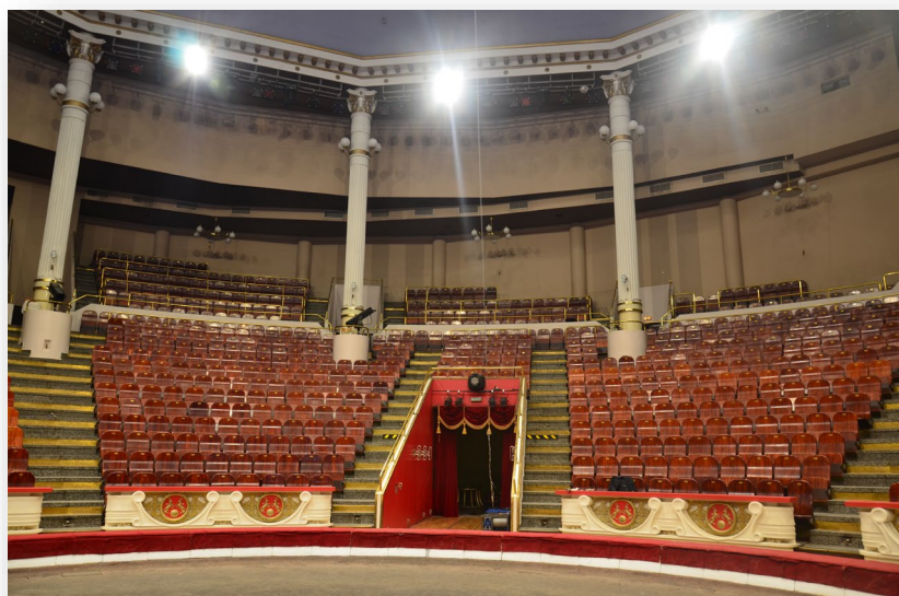
МОСКОВСКИЙ ЦИРК НИКУЛИНА