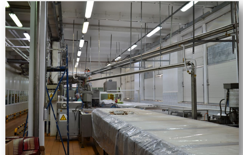
КОНДИТЕРСКАЯ ФАБРИКА «ПОБЕДА»